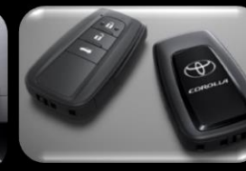
Control de entrada inteligente