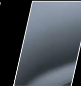
Gris azulado (1K3)