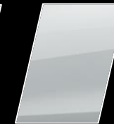
Super Blanco II (040)