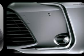
Luces anti-neblina LED