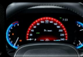
Pantalla multifuncional 7"