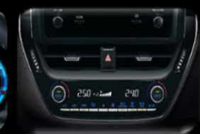
Aire acondicionado Bi-zona