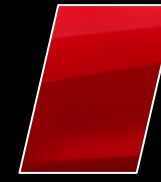
Rojo Mica Metálico (3R3)